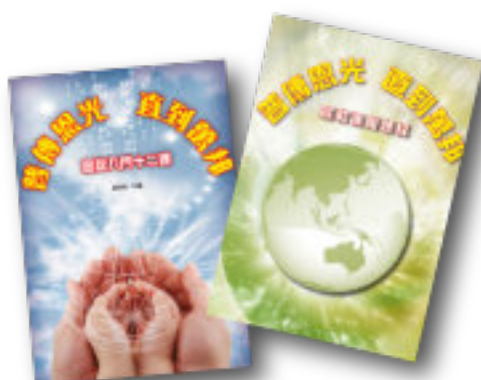
本會的基楚宣教課程：宣教入門及進階課程